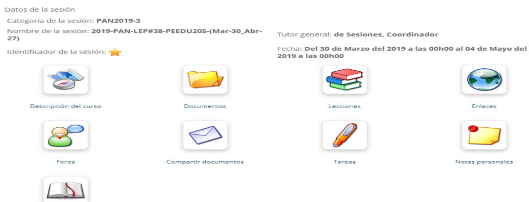
Imagen 1. Plataforma virtual

Para el desarrollo curricular se gestionó la capacitación tecnológica de los docentes facilitadores para el uso de la plataforma virtual, que ha sido certificada por parte del ente fiscalizador, a saber, la CTDA, para los procesos de enseñanza en la Modalidad Semipresencial y virtual; de las diversas carreras que forman parte de la Oferta Académica de ISAE Universidad. A continuación, se presenta la siguiente imagen: