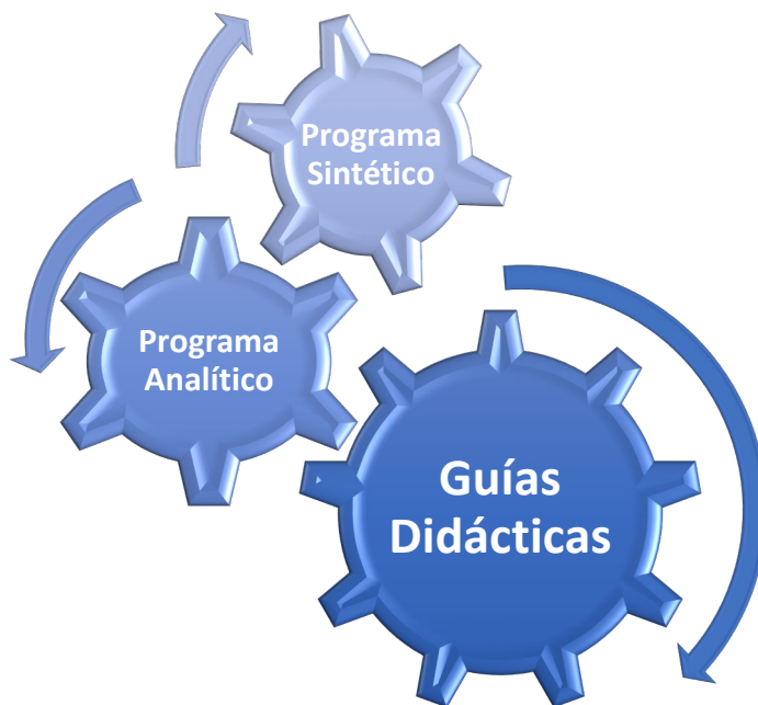
Imagen 2. La planificación docente

De manera particular, las denominaciones de uso generalizado en ISAE Universidad, se encuentran constituidas por los programas que permite la visualización de los elementos curriculares, en cuanto a coherencia, integración y desdoblamiento, según lo detallan la siguiente imagen: